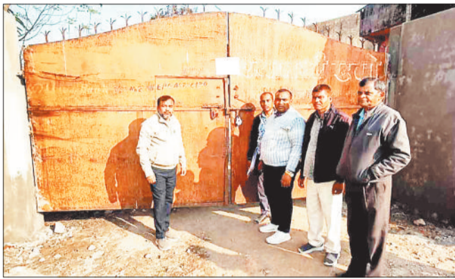
अवैध धान लोड गाड़ी एवं राइस मिल के गेट पर सील बंदी करते खाद्य विभाग के अधिकारी।